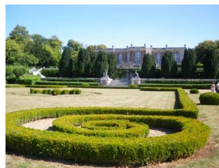
Le Château Neuf du Domaine de Condé

② Monter jusqu'à trouver une large allée à gauche : la prendre. A la RD560, tourner à gauche. Dans le lotissement, prendre à gauche le chemin. Longer l'étang à droite par la rive ouest et regagner le point de départ.