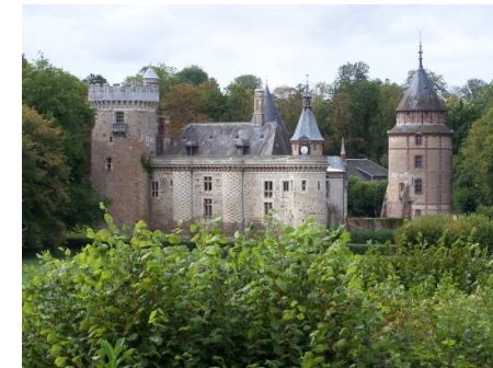
Le Vieux Château du Domaine de Condé

Office de tourisme du Pays d'Avre, d'Eure et d'Iton 129 Place de la Madeleine 27130 Verneuil-sur-Avre Tel : 02 32 32 17 17 www.tourisme-avre-eure-iton.fr