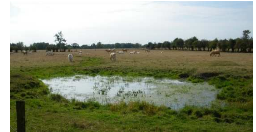
Ferme laitière du Puisseau