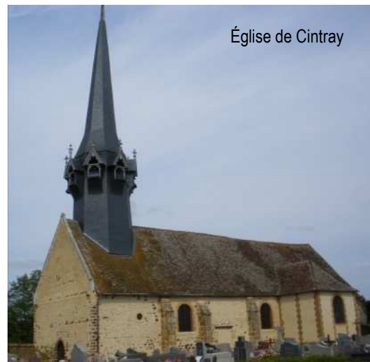
Église de Cintray

Office de tourisme du Pays d'Avre, d'Eure et d'Iton 129 Place de la Madeleine 27130 Verneuil-sur-Avre Tel : 02 32 32 17 17 www.tourisme-avre-eure-iton.fr