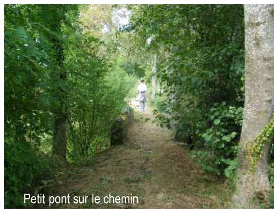
Petit pont sur le chemin