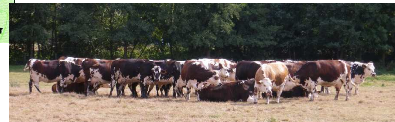
Élevage à la ferme du Puisseau

Office de tourisme du Pays d'Avre, d'Eure et d'Iton 129 Place de la Madeleine 27130 Verneuil-sur-Avre Tel : 02 32 32 17 17 www.tourisme-avre-eure-iton.fr