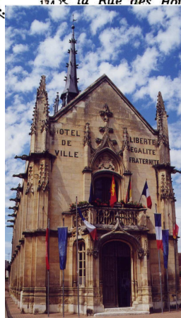
Hotel de ville de Breteuil-sur-Iton

① Face à la mairie, partir vers la gauche et passer par la place Pillon de Buhorel, puis les rues du Dr Lafaye, du Fourneau et de Sainte Anne. Dans cette dernière rue, s'engager dans le premier chemin à droite qui mène en plaine. Après 1 km, prendre à gauche le chemin transversal. Longer la route par la droite. Emprunter le rond point et suivre la direction de St Nicolas d'Attez sur 500 m.