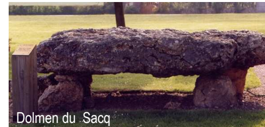
Dolmen du Sacq

Ce monument druidique d'environ 2.50 m, reposait sur trois autres pierres de moindre volume sur la rive gauche de l'Iton à Damville. Il témoigne de la présence gallo-romaine dans la région. Il fut déplacé sur la commune du Sacq, devant la mairie, il y a 40 ans.