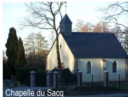
Chapelle du Sacq

Office de tourisme du Pays d'Avre, d'Eure et d'Iton 129 Place de la Madeleine 27130 Verneuil-sur-Avre Tel : 02 32 32 17 17 www.tourisme-avre-eure-iton.fr