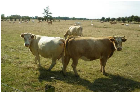
Vaches en pré