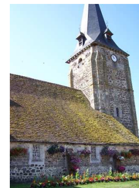
Église Saint Martin de Francheville

Office de tourisme du Pays d'Avre, d'Eure et d'Iton 129 Place de la Madeleine 27130 Verneuil-sur-Avre Tel : 02 32 32 17 17 www.tourisme-avre-eure-iton.fr