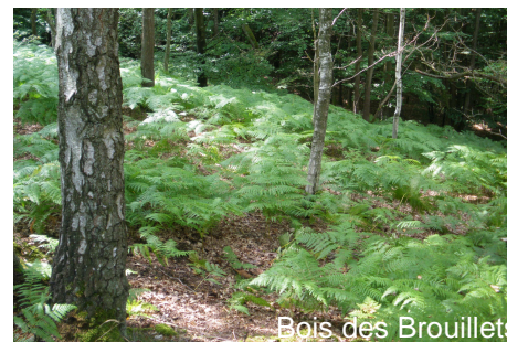
Bois des Brouillets

Office de tourisme du Pays d'Avre, d'Eure et d'Iton 129 Place de la Madeleine 27130 Verneuil-sur-Avre Tel : 02 32 32 17 17 www.tourisme-avre-eure-iton.fr