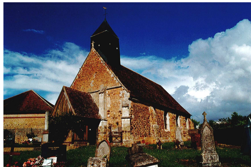
Église Saint-Nicolas de Saint-Nicolas-d'Attez

② A la route, continuer à droite sur 100 m, puis à gauche le sentier longeant le château d'eau. Prendre la route à gauche puis le 1 er chemin à droite au niveau des maisons. Suivre à droite la petite route qui fait suite et rejoindre le point de départ.