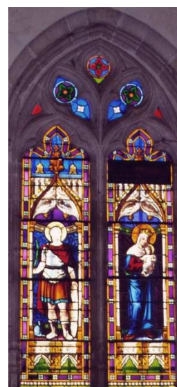
Vitrail de l'église de Condé-sur-Iton

③ Tourner à gauche (rue du Bois) puis au 1 er chemin à droite. Longer l'étang à droite et rejoindre le point de départ par la route à gauche.