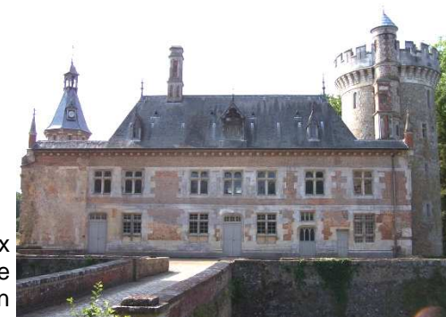
Le Vieux Château de Condé-sur-Iton

Office de tourisme du Pays d'Avre, d'Eure et d'Iton 129 Place de la Madeleine 27130 Verneuil-sur-Avre Tel : 02 32 32 17 17 www.tourisme-avre-eure-iton.fr