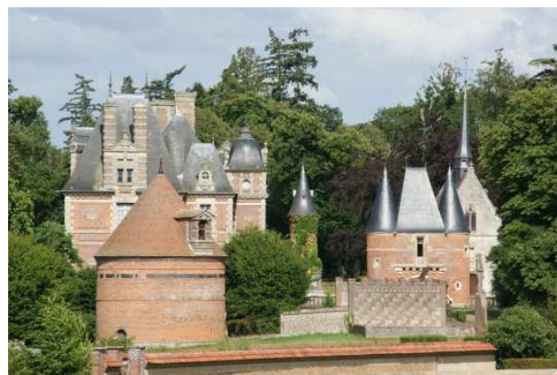
Château de Chambray

Office de tourisme du Pays d'Avre, d'Eure et d'Iton 129 Place de la Madeleine 27130 Verneuil-sur-Avre Tel : 02 32 32 17 17 www.tourisme-avre-eure-iton.fr