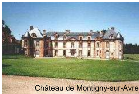
Château de Montigny-sur-Avre

Office de tourisme du Pays d'Avre, d'Eure et d'Iton 129 Place de la Madeleine 27130 Verneuil-sur-Avre Tel : 02 32 32 17 17 www.tourisme-avre-eure-iton.fr