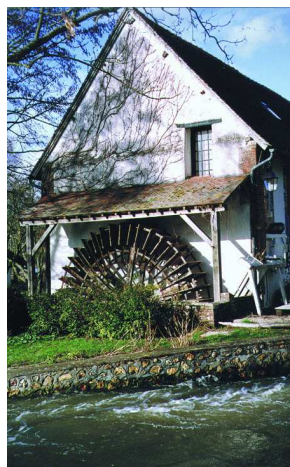
Moulin de Février

④ 500 mètres plus loin, s'engager sur la route à droite et de nouveau à droite au premier chemin. Au rond point, suivre en face la rue du Haut Verrière pendant un kilomètre.